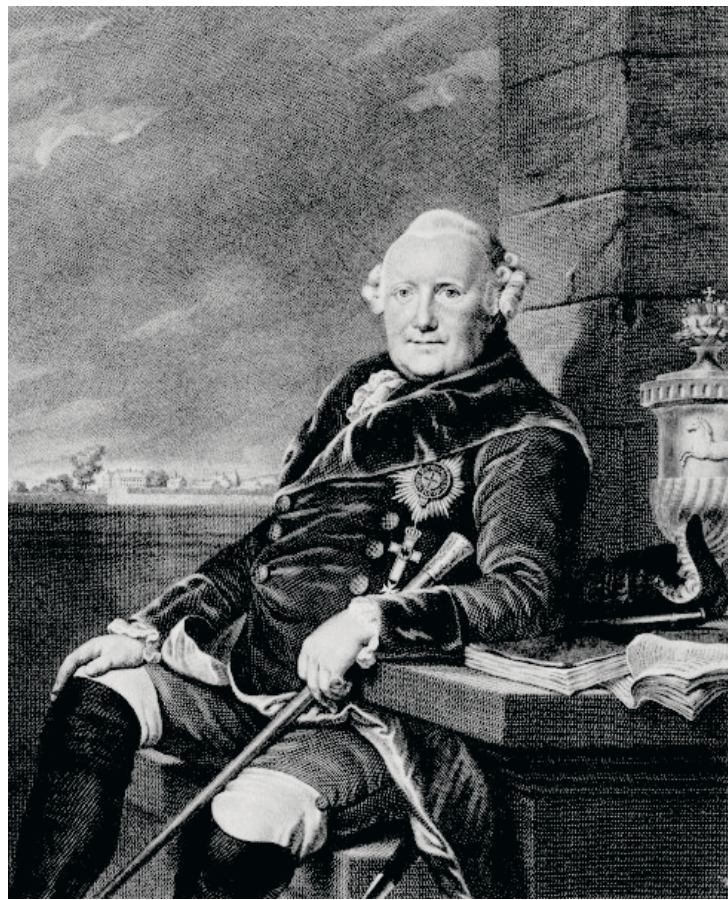
Duque Ferdinand, personagem histórico da Maçonaria

bém passeiam pelas páginas da biografia escrita por Jacq toda uma multiplicidade de referências às sociedades secretas como os Illuminati da Baviera e a Estrita Observância Templária assim como figuras históricas como Jean Baptiste Willermoz e o Duque Ferdinand de Brunswick. O Mozart de Jacq é palatável e honesto. É possível lê-lo apenas como uma trama que tematiza o papel das sociedades secretas num contexto como o que precede as grandes transformações históricas desencadeadas pela Revolução Francesa. Isto não impede também