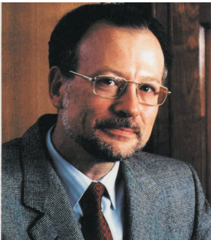
Christian Jacq, autor de 'Mozart – O Amado de Ísis'