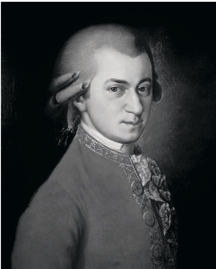
O compositor Wolfgang Amadeus Mozart (1756 – 1791)